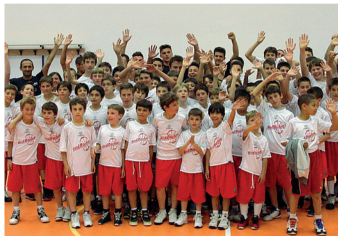
I ragazzi della Soul Basket: dieci squadre per la terza realtà cittadina

Soldi sprecati I surrogati di cui sopra hanno la forma e la dimensione, spesso assai ridotta, delle palestre scolastiche. Alla Soul costano 35 mila euro all'anno, coi bambini che provano a emulare Kobe e LeBron tirando a canestri traballanti e spogliandosi in stanzoni privi